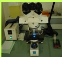
Microscope à fluorescence