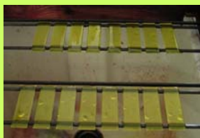
Coloration par recouvrement : 32 mn